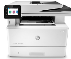
Imprimante multifonction HP LaserJet Pro M428fdw

Cette imprimante utilise la sécurité dynamique qui peut être régulièrement mise à jour par des mises à jour du micrologiciel. L'imprimante est conçue pour être utilisée uniquement avec des cartouches dotées d'une puce HP authentique. Les cartouche utilisant une puce non-HP pourraient ne pas fonctionner ou arrêter de le faire. Plus d'informations sur: Pour en savoir plus, consultez: www.hp.com/learn/ds